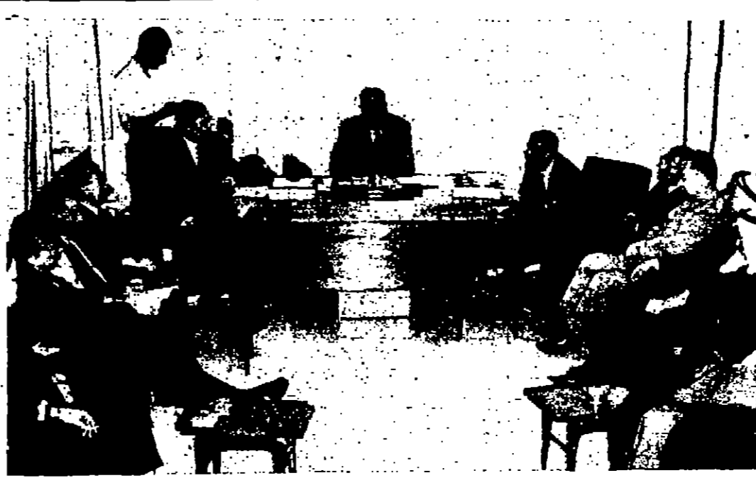
السيد حاتم الجبوسي وزير المائيريس اللجنة الوزارية للافلا اقتراحين تحدثت في ندوة وزارية الحوار محققة البقاء امس تصوير و.ا.ا.

لندن - رويتر - حذر جلالة الملك الحسين عامل الاردن من ان الوقت قد يفوت على ايجاد حل لازمة الشرق الاوسط . وابلغ جلالاته مؤتمرا صحفيا قوله انتم اعد متفلا الى الحد الذي كنته قبل حين .